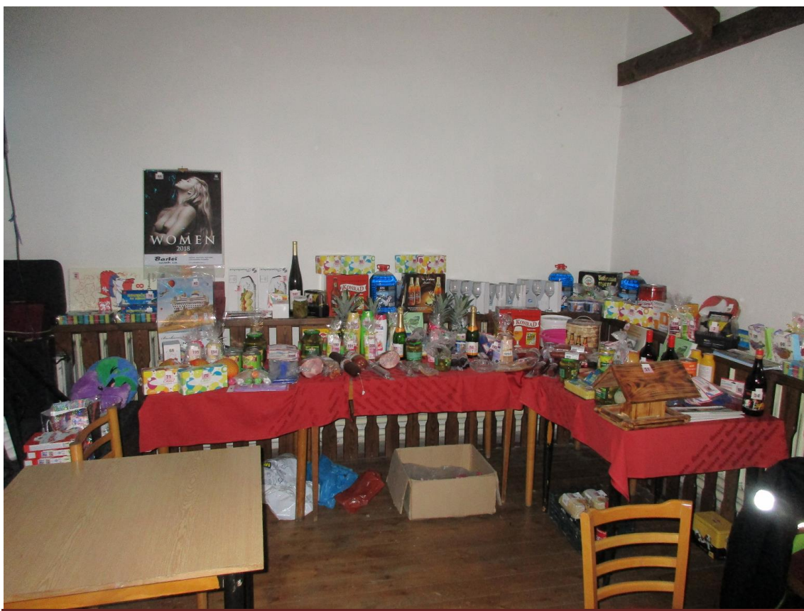
Kronika obce Oldřichov v Hájích 2018