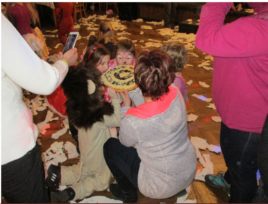
Kronika obce Oldřichov v Hájích 2018