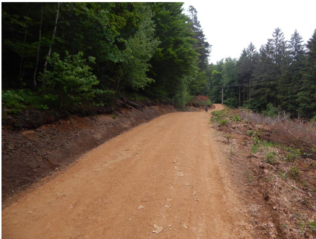
Nová cesta do Oldřichovského sedla