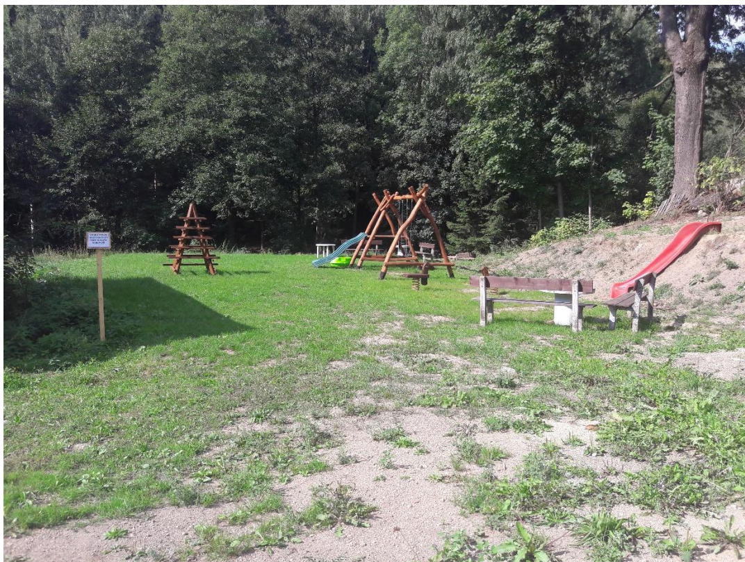
Nový povrch cesty k bývalé školce