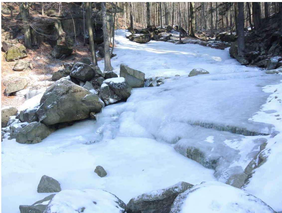
Bruslení na zamrzlém Písáku