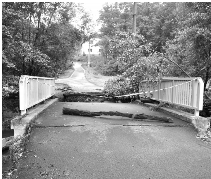
ilustrační foto: Podemletý a propadlý most ke Grünhutům.

Předpokládaný termín úplného dokončení je stanoven na květen příštího roku.