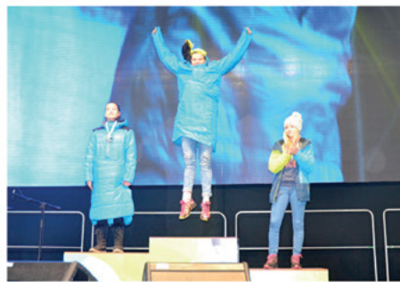
Z medailí na zimní olympiádě se nejčastěji radovala mládež z Libereckého kraje.

Celkem čtrnáct zlatých, patnáct stříbrných a deset bronzových medailí přivezli mladí sportovci z VIII. Her zimní olympiády dětí a mládeže ČR 2018, které se konaly v Pardubickém kraji. Liberecký kraj díky jejich skvělým výsledkům obsadil první místo mezi krajskými reprezentacemi, a to jak v bodovém hodnocení, tak co do počtu cenných kovů. Krajskou reprezentaci tvořilo dohromady 123 osob, z toho 94 sportovců a 29 trenérů. Mladí nadějní sportovci se utkali o medaile i bodová hodnocení v devíti zimních sportech – alpské lyžování, běžecké lyžování, biatlon, krasobruslení, lední hokej, lyžařský orientační běh, rychlobruslení, skicross, snowboarding a dvou doprovodných disciplínách – taneční soutěž a šachy. Mladí sportovci nasadili laťku velmi vysoko, bude to pro ně velká výzva, protože Liberecký kraj převzal pomyslnou štafetu a bude pořadatelem letních olympijských her dětí a mládeže v roce 2019.