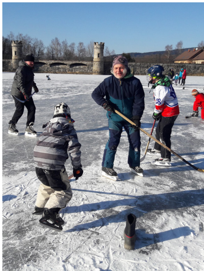
Bruslení na zamrzlé Fojtce

provozní doba: pondělí 14:00 – 16:00, středa 14:00 – 17:00