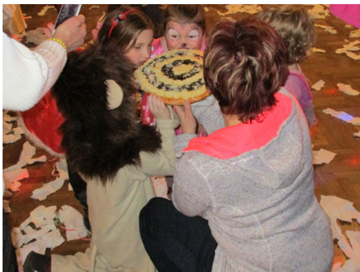
Foto z dětského maskarního rejse

začátek června, termín bude upřesněn park u obecního úřadu