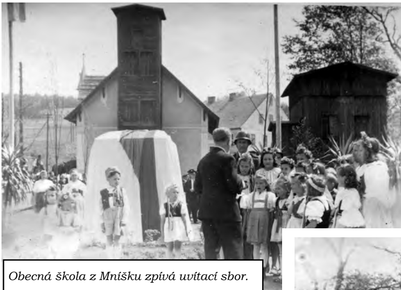
Obecná škola z Mníšku zpívá uvítací sbor.

v parčíku naproti restauraci Beseda. Slavnost z pátého května 1946 popisuje kronikář Ladislav Ulrych: „Na paměť vítězství byl na jaře roku 1946 postaven v parčíku přes silnici vedle Besedy pomník osvobození podle návrhu dělníka ve Starkstromu pana Mesteka. Odhalení pomníku dne 5. 5. 1946 bylo doprovázeno velkou slavností, již se zúčastnili i občané okolních obcí. Program byl zajištěn dětmi a pozvanými řečníky. Na závěr slavnosti zasadili členové Svazu zemědělské mládeže 4 lipy svobody.“