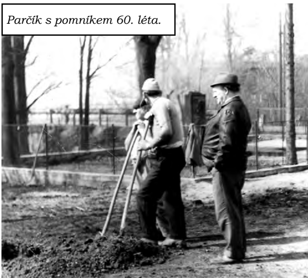
Parčík s pomníkem 60. léta.