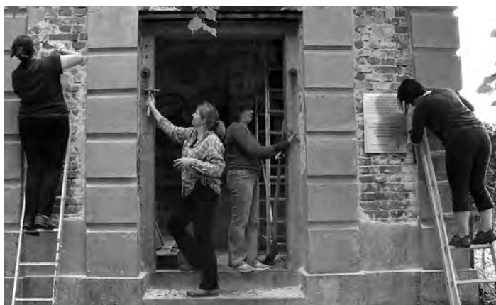
Zapsala Jiřina Vávrová