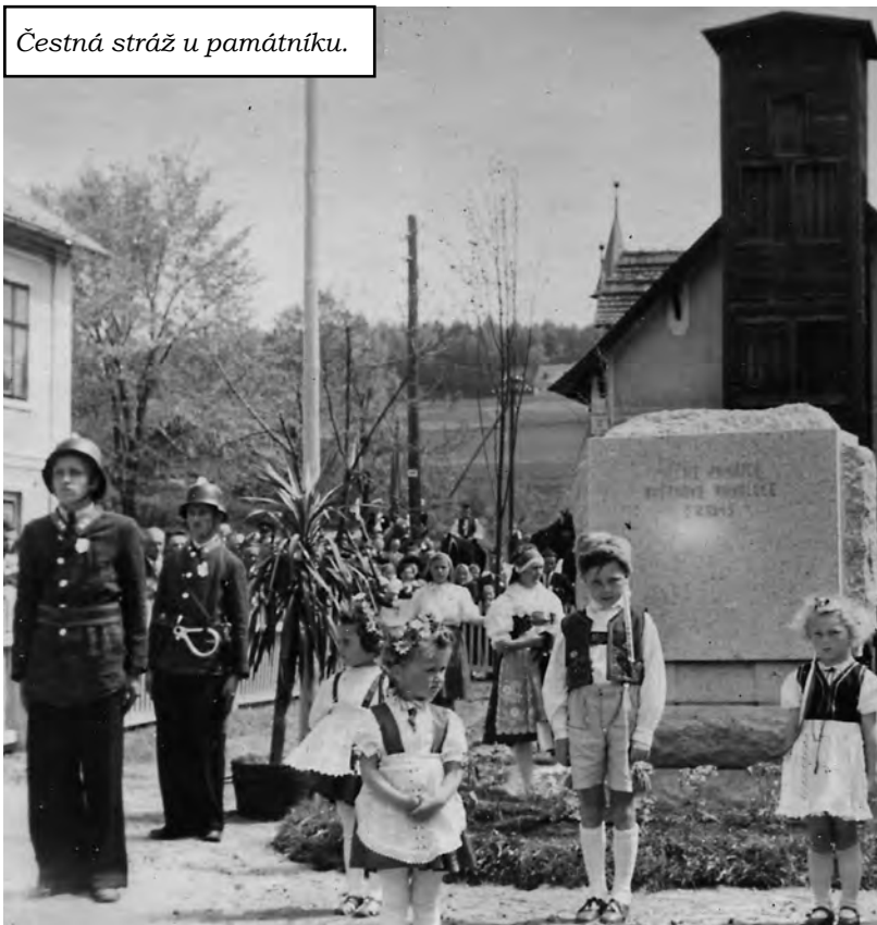
Čestná stráž u památníku.