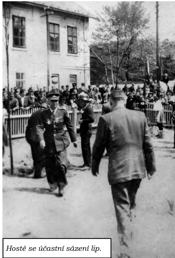
Hosté se účastní sázení lip.