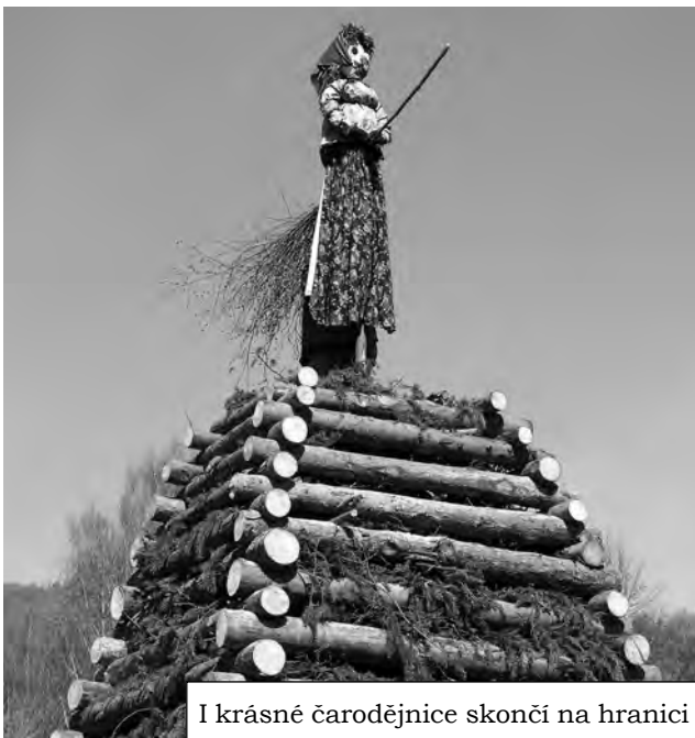
I krásné čarodějnice skončí na hranici