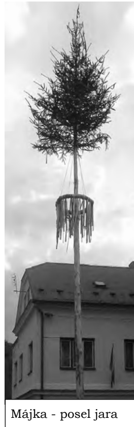
Májka - posel jara