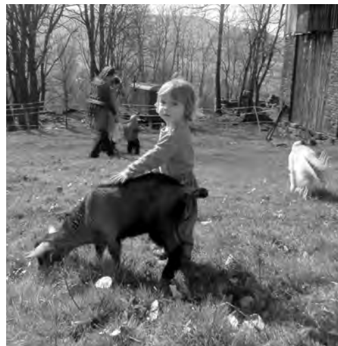
Za Klubík Zuzka Senohrábková

Pro některé děti byl také jistě velkým zážitkem výšlap do prudkého kopce od obecního úřadu. Musím je pochválit, děti tapaly statečně.