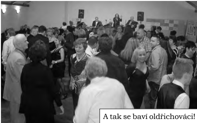
A tak se baví oldřichováci!